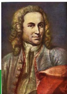
ヨハン・ゼバスティアン・バッハ (1715 年頃)