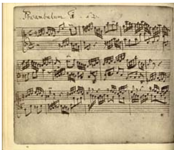
Praeludium 1 à 2