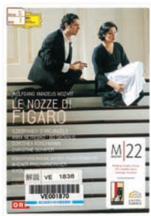
請求記号●VE1870 『フィガロの結婚』ユニバーサル UCBG-1202~3

●くさくさよしひろ この紹介に至るまで、書いては消す...を繰り返したのはひとえにこの作品の濃密な3時間をお伝えしたかった故!