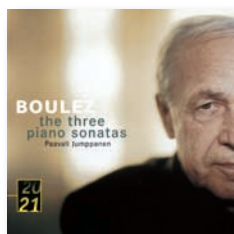
請求記号●XD55723 The three piano sonatas / Boulez. Deutsche Grammophon, UCCG-1227

今もなおこの曲は僕の興味をそつて止まない。是非この機会に皆さんに聴いていただきたいと思う。