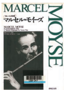
請求記号●C60-347 ワイ、トレバー『マルセル・モイーズ：フルートの巨匠』 音楽之友社 ※現在は絶版

他にもたくさんエピソードがあるが、これらは自分で読んでみてほしい。そしてできれば、モイーズの演奏も聴いてみてほしい。（図書館にも幾つかCDがおいてあるので）華やかでまるで歌をうたっているかの様なモイーズの演奏はドラマチックで、愛にあふれている。彼のフルートを聴いてこの本を読めば、きっと貴方もこのつむじ曲がりのおじいさんを好きにならずにはいられないと思う。