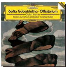
請求記号 ● XD7207 Offerium ; Hommage à T.S.Eliot / Sofia Gubaidulina (Deutsche Grammophon F00G 20384) *現在の発売番号 UCCG-3513

彼女は「私は音楽を構築するというよりは、木が何度も枝を伸ばし、葉や新芽を出すように音楽を耕す。」と語っています。私も作曲するという行為が、いつか自然とおこなえるように、自分の中にしかない音を見つけて世界に一つしかない木を育てて行こう。