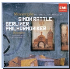
請求記号 ●XD60561 『展覧会の絵：組曲／ムソルグスキー』TOCE-56025 Licensed by EMI Music Japan Inc.

●くどう よしひろ 1月に来日するベルリン・フィルとラトル氏。その先駆けともなる幻想交響曲のCDが発売され、すっかり有頂天ノこちら是非！